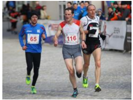
Siegertrio 10 km Lauf