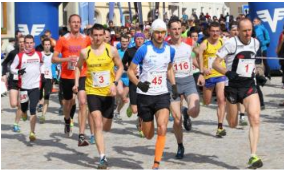
Start 10 km Lauf