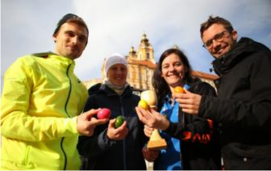
Sieger und Siegerinnen 5- und 10 km Lauf